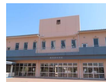
3年間を共に過ごした学び舎

ごてんやま 歴史に映えて 御殿山 理想呼ぶ 学びの園よ 花ひらく 文化の道は 栄光の 峰につづけり はつらつと 郷土 担いて 起てよ いざ 湊中学