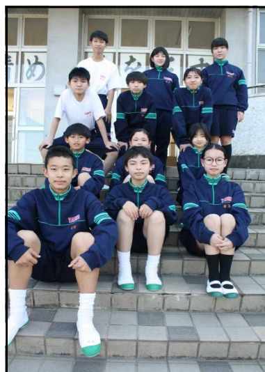
〔前期学級委員生徒〕