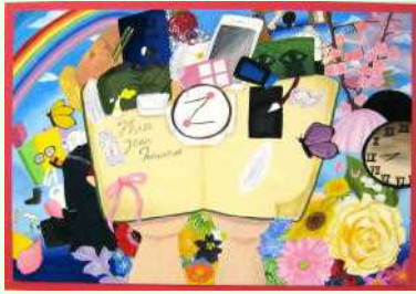
「Three Year's Memories」

去る11月25日～28日に、ザ・ヒロサワ・シティ会館において展覧会が開かれ、本校からも生徒の作品が展示されました。紹介します。