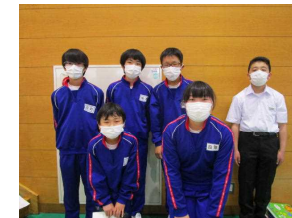
<実行委員のみなさん>

万が一、現地で発熱やけが等が発生した場合には、保護者の方にご連絡いたします。場合によっては保護者の方に現地まで迎えに来ていただくこととなります。特に発熱の場合には、現地の病院にかかることとなります。