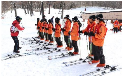
スキー宿泊学習 (1年生)

今年度も、 生徒の健やかな学びを保障していくことが最重要である と考え、コロナ感染、インフルエンザ対策をとりながら可能な限り学校行事や部活動等を実施してきました。合唱祭や体育祭、修学旅行やスキー宿泊学習、職場体験学習や学年レクリエーション等についても有意義な教育活動であるためその教育的意義や生徒の心情等を踏まえ実施して参りました。ご理解・ご協力に感謝いたします。ありがとうございました。