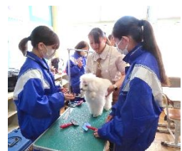
職業人の話を聞く会 トリミング体験