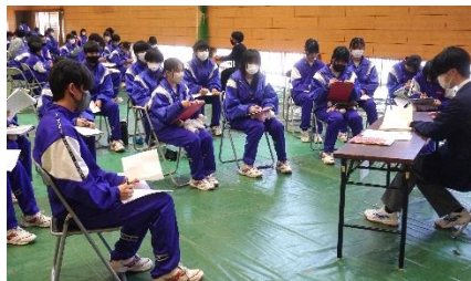
先輩の話を聞く会 (2年生)