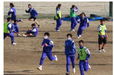
全校レクリエーション「逃走中」