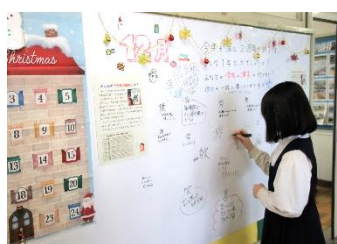
「みんなのホワイトボード」から

そこで、生徒の皆さんにも「今年の漢字」を聞いてみました。2023年はどんな1年だったのでしょうか？