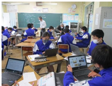
【社会科の資料検索での活用】