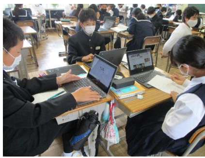
【国語科の創作活動での活用】