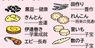
黒豆…健康 田作り…豊作 きんとん…金運 れんこん…将来の見通し 伊達巻き…学業成就 りいも…子宝 エビ…長寿 数の子…子宝