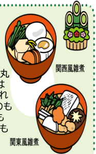
関西風雑煮 関東風雑煮

地域の食材を使った、もち入りの汁物。主に西日本では丸もち、東日本では角もちが用いられます。あん入りのもちを入れる所、もちを入れない所もあります。