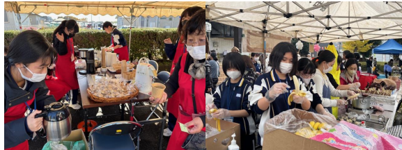
喫茶コーナー・チョコバナナコーナー（美術部）

11月中旬に一中コミセンでコミセン祭りが開催され、美術部・野球部のお子さんがボランティアで参加しました。チョコバナナコーナー・工作・喫茶コーナー等で販売の手伝いやストラックアウトコーナーで小学生に投げ方の伝授を行うなど大活躍でした。また、美術部の作品を展示して、地域の方々に大変喜ばれ、日頃の活動の成果を表現するよい機会となりました。