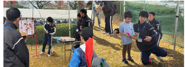
ストラックアウトコーナー（野球部）