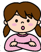
1日の食塩相当量の目標量

食塩（ナトリウム）のとり過ぎは、生活習慣病の原因になることがわかっています。厚生労働省では右下の表のように目標量を定めていますが、最近の調査によると3g程度上回っている現状があります※。日ごろから「減塩」を意識し、できることから実践していきましょう。