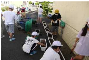
環境委員会の活動