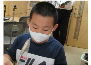
終業式での代表児童あいさつ