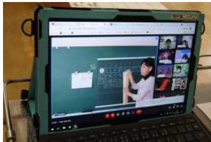
オンライン授業の画面

9月中は、ほとんどの日で、オンライン授業を実施しました。初めは子供たちも慣れない学習方法で戸惑っているようでしたが、徐々に慣れてきて、考えを発表をしたり、音読をしたりして、教室での授業にできるだけ近い学習ができるようになってきました。ご家庭でもご協力をいただきありがとうございます。今後も子供たちの学びを止めることないよう手立てを講じていきたいと思ひます。