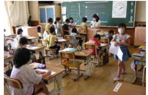
登校日での授業の様子

また、これまで通り手洗やマスクの着用等新型コロナウイルス感染症対策もしっかりできるようご協力をお願いします。学校でも十分に注意した感染症対策を行っていきます。