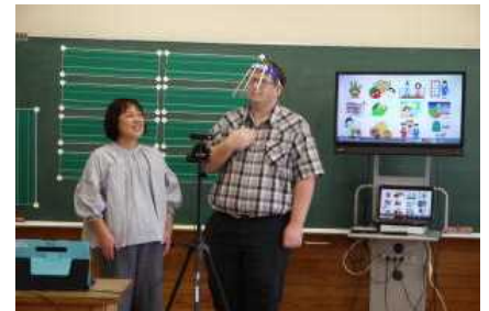
外国語のオンライン授業