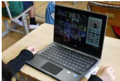
オンラインホームルームの練習

今後も学校のICT化は、進んでいくと思いますが、何かご不明な点や、ご意見がございましたら、学校に連絡をいただけたらと思います。よろしくお願いたします。