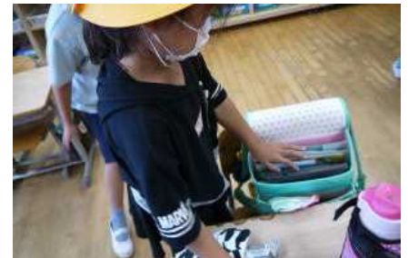
タブレットの持ち帰り