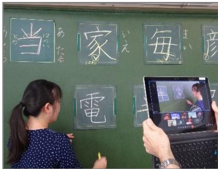
授業のポイントを撮影し、分かりやすく提示しました。

今後、様々な学校行事や学習活動を充実させていくとともに、子どもたちの学習の定着や心身のケアに努めて参ります。また、10月は、前期と後期の切り替えの時期になりますので、お子さんの良さや伸ばしていきたい力などをご家庭でもお話し合いいただき、気持ちを新たに、意欲を高めていただきますようご配慮いただければ幸いです。