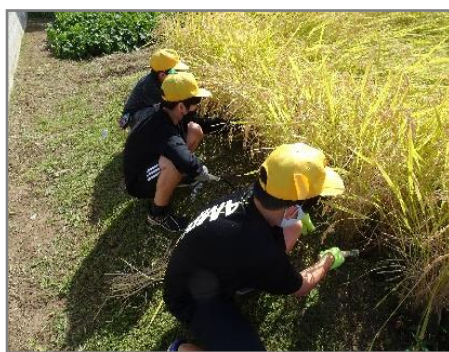
5年生が分散登校の2日間で稲刈りを行いました。