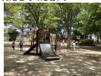
公園探検に行きました。

7日(金)にひらがなテストを実施予定です。練習プリントから出題予定です。とめ、はね、はらい等ご家庭でもお声掛けよろしくお願いいたします。