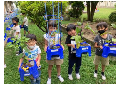
野菜を観察したよ!