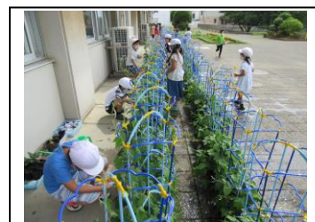
水やりを頑張っています。

「なつとなかよし」で色水遊びをします。14日(水)に、色水ができそうな花や実がありましたら、薄手のビニール袋3枚、ゼリーカップ3個と合わせて持たせて下さい。傷んでしまうので、花や実当日に持たせて下さい。