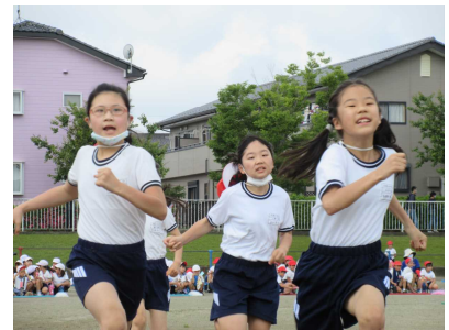
「ゴールは、もうすぐ！」