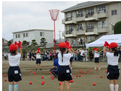
「チェッチェッコリ〜♪」