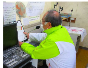
放送でメッセージを送る校長

ひたちなか市立長堀小学校 住所：ひたちなか市長堀町3丁目5番1号 電話：029-274-5800