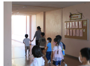
就学時健康診断の一コマ

ひたちなか市立長堀小学校 住所：ひたちなか市長堀町3丁目5番1号 電話：029-274-5800