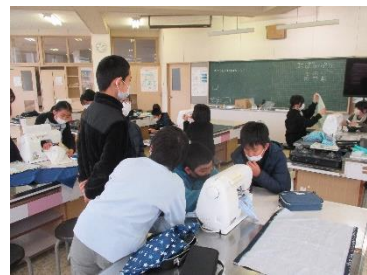
はじめてのミシン