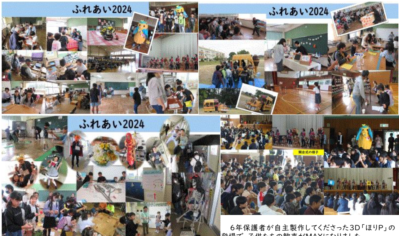
6年保護者が自主製作してくださった3D「ほりP」の登場で、子供たちの歓声がMAXになりました。

県では、教育に対する関心と理解をいっそう深める機会として、毎年11月1日を「いばらき教育の日」、11月を「いばらき教育月間」としています。本校では、毎朝あいさつ運動を実施していますが、今月が特に強化してがんばっています。【写真:左】また、本校では、教育の日(11月1日前後を含む期間)に、学校と家庭と地域の連携を深めるためのイベントとして『ふれあい』を実施しています。新型コロナウイルス感染症が流行した時期から、感染対策のため規模を縮小して実施してきました。今年度の『ふれあい2024』は、久しぶりに、オープニングセレモニー(堀口太鼓)や自治会等(堀口・武田・本町自治会、堀口無線会)の参加や喫茶室が復活しました。10月26日(土)は、まさに学校・家庭・地域が連携を図った盛り上がりを見せました。