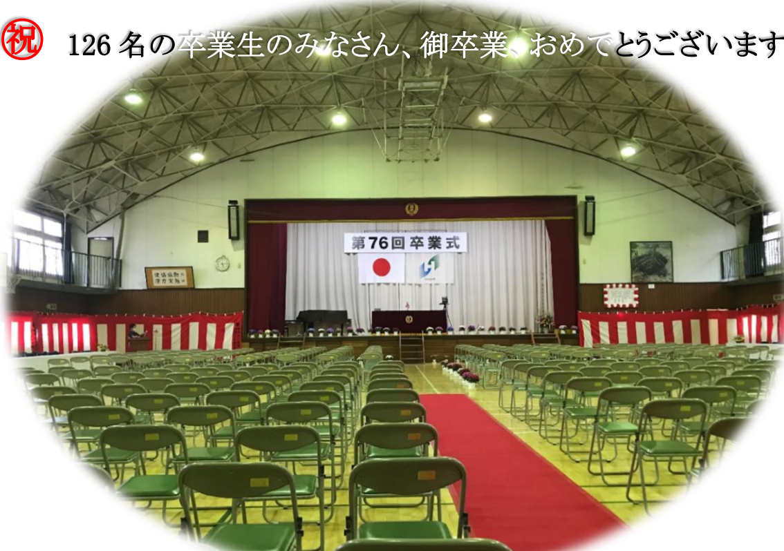
卒業にあたり、6学年担当の先生から卒業生に一言ずつメッセージをいただきました。