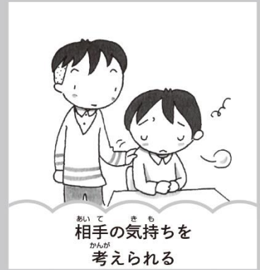
相手の気持ちを 考えられる