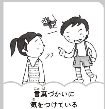
言葉づかいに 気をつけていく