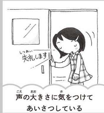
声の大きさに気をつけて あいさつしている