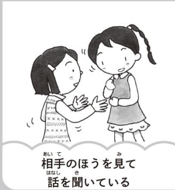
相手のほうを見て 話を聞いている