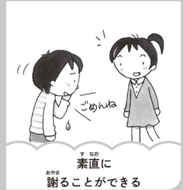
素直に 謝ることができる