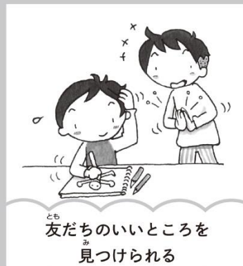
友だちのいいところを 見つけられる