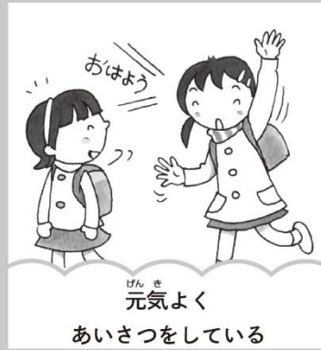
元気よく あいさつをしている