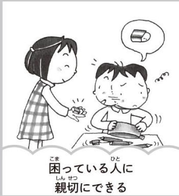
困っている人に 親切にできる