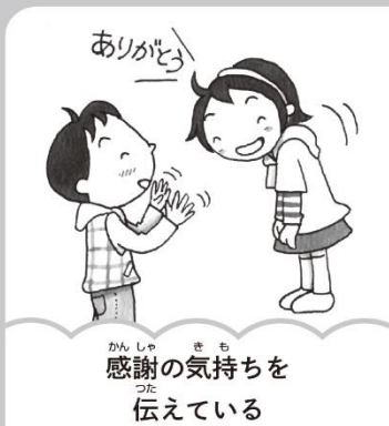
感謝の気持ちを 伝えていく