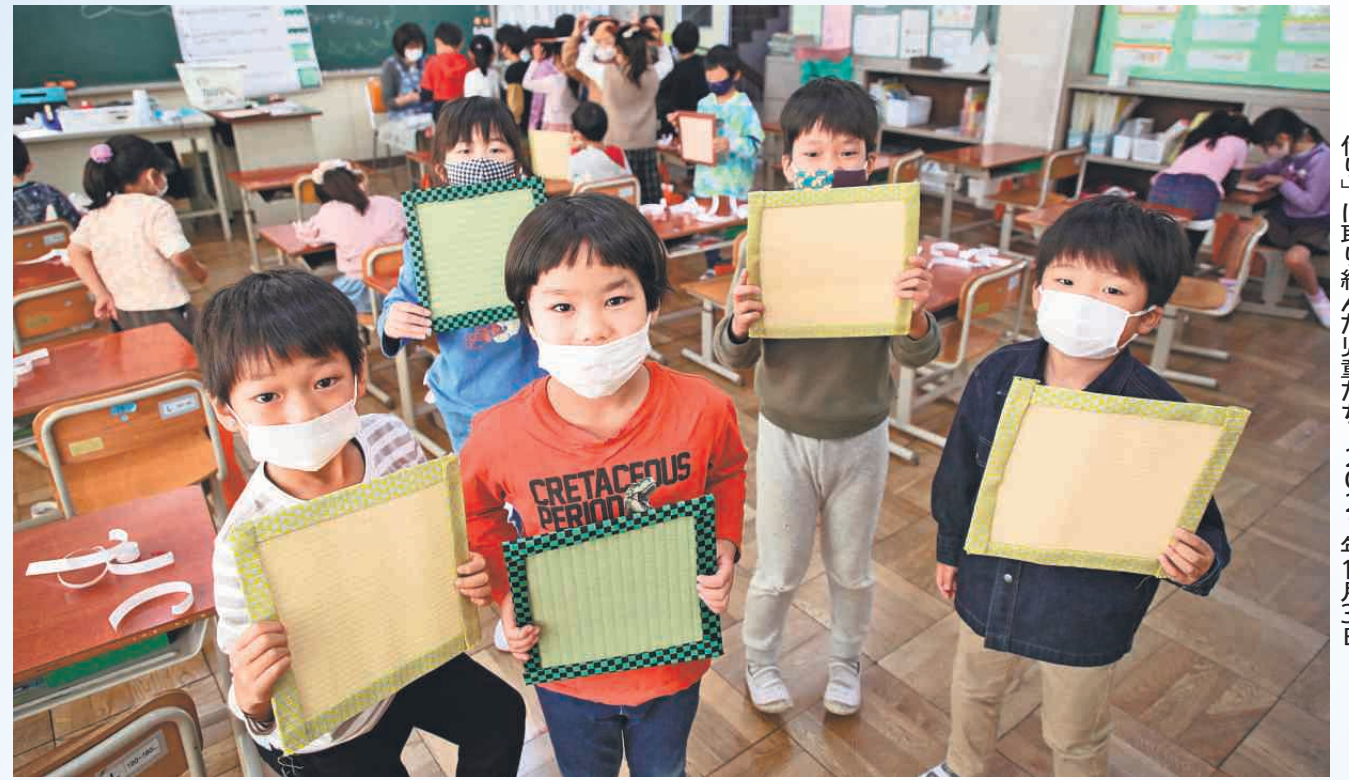
東石川フェスティバルの企画「たたみコースター作り」に取り組んだ児童たち。2021年10月30日