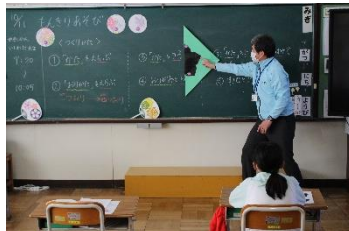
【講師の先生の説明】

このほかにも会場には各学年の絵画等の作品を展示する予定です。日頃の子供たちの学習の成果をご覧いただければ幸いです。