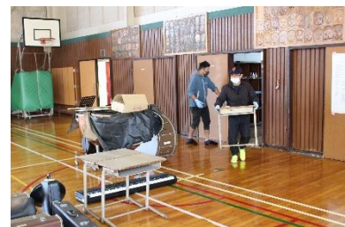
【すみずみまできれいになりました】