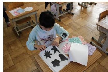
【どれにしようかな？】