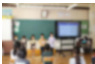
【ダンゴムシの足は14本です。○か×か。】

校長ほか担任外の教職員や3・4年生児童がクイズ大会に招かれ、1・2年生が作成した虫クイズを楽しみました。意外と難しい問題もあり、たくさんの新しいことを楽しく知ることができました。