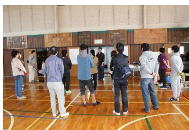
【たくさんの方にご協力いただきました】

10月28日（土）にPTA奉仕作業を実施しました。今回は、11月3日の記念行事に向けて、会場となる体育館の清掃や椅子やテーブル、看板等の掲示物の設置など会場準備を行いました。作業にご協力いただいた保護者の皆様、ありがとうございました。