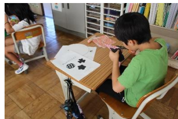
【慎重に切らないと…】