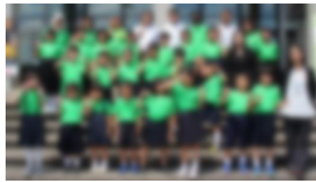
【「クラフトシビックホール土浦」前で記念撮影】

保護者の皆様、当日までの子供たちへのサポートと当日の楽器運搬等でのご協力ありがとうございました。