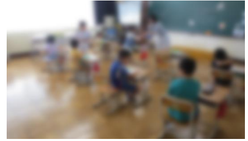
【元気に9月の学校生活をスタートしました】

9月1日、子供たちの元気な声が学校にもどってきました。それぞれの教室では、夏休み中の課題を提出し、9月の学校生活がスタートしました。9月からも、保護者の皆様、地域の皆様、子供たちへの温かい見守りを引き続きよろしくお願いいたします。