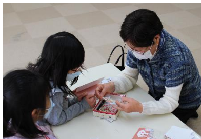
【折り紙でうさぎの絵馬を作りました!】