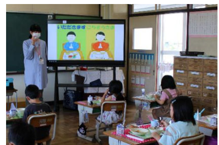
【正しいお箸の使い方について真剣に学習しました】