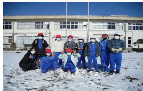
1月 みんなで雪遊びをしました。