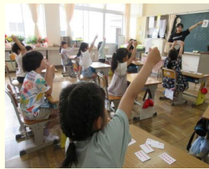
【楽しみながら数に親しむ算数科学習】