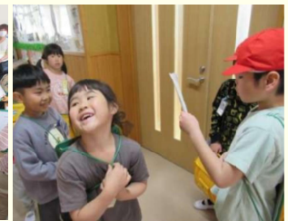
【2年生と一緒に学校探検（よりよく他者と関わって）】

4月26日には、近隣の幼児教育施設保育者による1年生の学習参観（市教育委員会指導主事も同行）と、保育者と1年担任教師とで相互理解・スタートカリキュラム実践を深めるための合同協議を行いました。