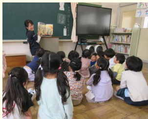
【担任教師による絵本の読み聞かせ】