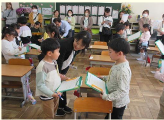
【どうぞ、よろしく！お互いに自己紹介】