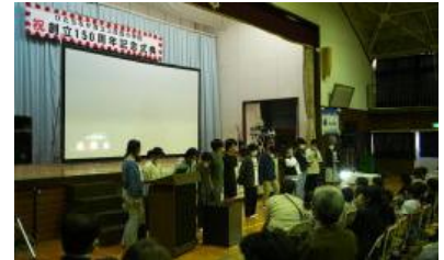
『三反田小の歩み』発表(6年生)