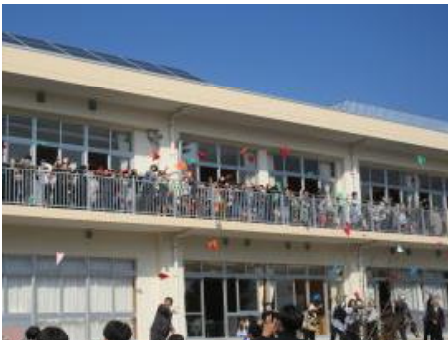
150機の紙飛行機飛ばし