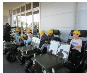
タックスインザキ