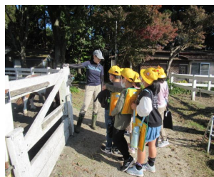
セント乗馬クラブ