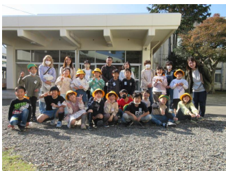
引率保護者の皆様と2年生

11月24日に、2年生が生活科の授業で町探検を実施しました。昨年度に引き続き今年度も、7人の保護者の方々が、引率の協力をしてくださいました。お陰様で、7事業所の皆様に見学のご協力を得て、充実した活動をすることができました。