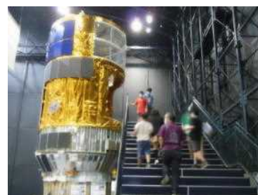
『筑波宇宙センター』

6月25日(金)には、6年生の遠足を実施しました。こちらも例年は、東京方面の遠足を実施していましたが、今年は、『いばらきフラワーパーク』と『筑波宇宙センター』へ行ってきました。『いばらきフラワーパーク』では、きれいに整備された芝生の丘やたくさんの花苗の植えられた花壇、小高い山の頂上に設置された展望台などがあり、好天の下、楽しくウォーキングをしたり、ポタニカルカード作りをしたりしました。グループの友達と笑顔で活動できました。『筑波宇宙センター』では、ロケットや人工衛星の大型模型を見学したり、宇宙に関するクイズに答えたりしました。とても迫力がありました。児童のみなさんが大人になる頃は、ロケットも、もっと進化していることでしょうね。宇宙旅行も、できるかもしれませんね。