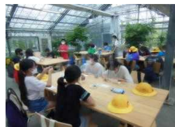
『いばらき フラワーパーク』