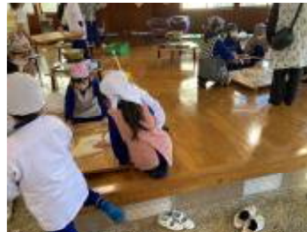
【手打ちうどんづくり：混ぜ合わせてこねる→足で踏む→麺棒で生地をのばす】