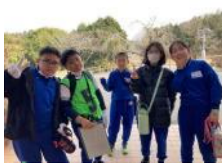
【ウォークラリー：10班全て無事に笑顔でゴールできました】