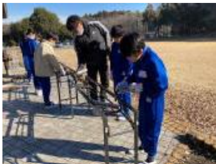
バーナーで板を焼く