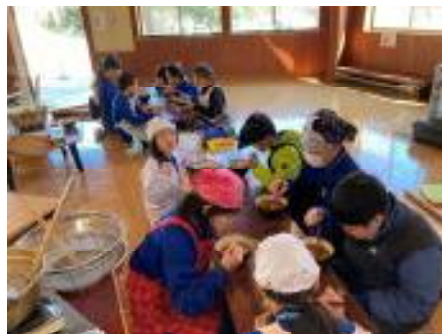
【びょうぶたたみに折った生地を麺切包丁で切る→ゆでる→調理室で作っていただいたカレーをかけていただきます】