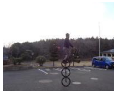
【夕竹が3つもある一輪車？でお出迎え】