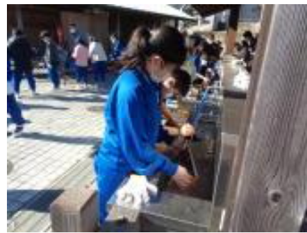
たわしでごしごし洗う】