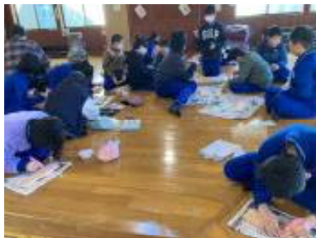
【焼き杉体験：のりで文字を書く