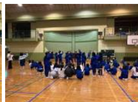
【キャンプファイヤー：第1部 点火の式 第2部 レクリエーション 第3部 消火の式】

点火の式と消火の式は、厳粛に行い、レクリエーションは、たいへん盛り上がりました。踊り（よさこい、エイサー、マイムマイム）、じゃんけん列車、〇×クイズ、ゲーム等を楽しみました。たくさん声を出して、たくさん体を動かして…とても楽しい時間でした。