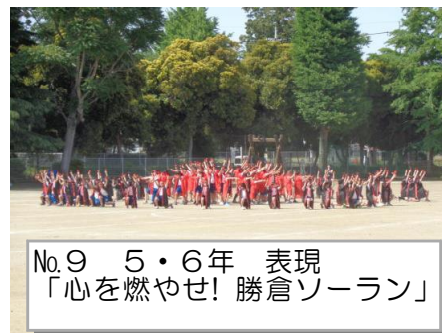
No.9 5・6年 表現 「心を燃やせ! 勝倉ソーラン」