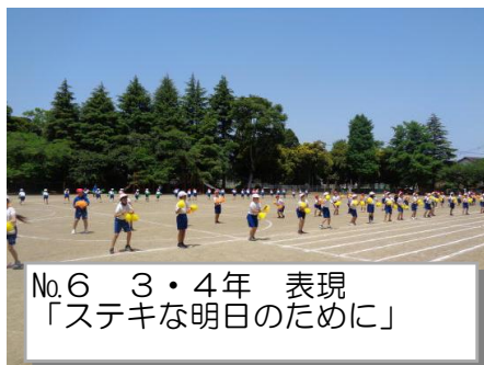
No.6 3・4年 表現 「ステキな明日のために」