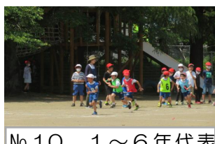
No.10 1～6年代表 「It's SHOWTIME」 ～勝倉スピードチャンピオン～ 1チーム12人。6チームで競います。1～5年生は半周。6年生は、1周走ります。