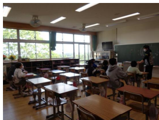
【進行（会場を兼ねる）】

運動会では、5・6年児童が係の仕事を行います。当日までに、係活動の時間が2時間あります。それぞれの係の児童が仕事を分担し、運動会の運営に当たります。係の仕事ぶりにもご注目ください。