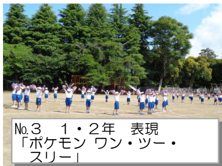
No.3 1・2年 表現 「ポケモン ワン・ツースリー」