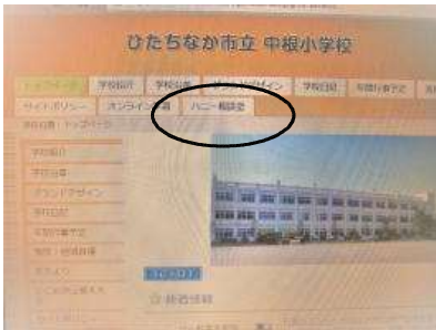
【中根小HPのトップページ】

本市では、児童の SOS を出しやすい環境づくりを推進するため、校内オンライン窓口を各小学校においても設置することになりました。学校HPに校内オンライン相談窓口「ハニー相談室」を設置しました。各教室において、児童が実際に相談フォーム（Google Form）へ相談の仕方や利用方法等を確認しています。ご利用はタブレットからの相談となります。相談についての確認は校内の窓口担当職員が、1日3回定期的に行います。なお、対応時間は、平日、勤務時間内の8:15～16:40です。