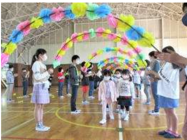
【ようこそ中根小へ】

会の運営も、6年生の態度もとてもすばらしく、6年生は、中根の子のすばらしさを、自ら1年生に示していました。「中根小の妖精 ハニーちゃん」も登場して、1年生を歓迎していました。