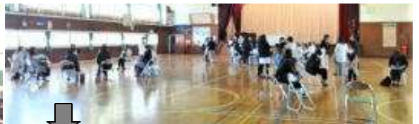
授業参観後のPTA 専門委員会の様子です