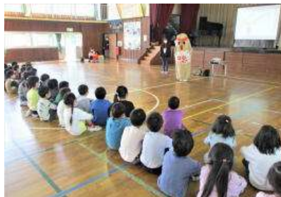
【ハニーも歓迎しているよ】