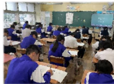
【中間テストに臨む各学年の生徒 (左から、1年、2年、3年)】