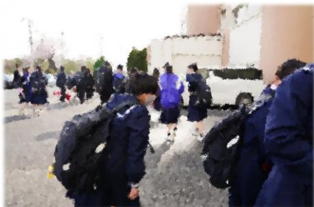
【登校、新任式、始業式、学級担任、部活動顧問発表の様子 4月8日(月)】

さて、今日は、私のみなさんへの「願い」をお伝えします。みなさんが大学などの上級学校を卒業する頃には、どんな社会になっているでしょうか?その中では、どんな力が必要とされるのでしょうか?想像するのは難しいですね。確実に言えることは、変化のスピードがとても速く、学生時代に学んだ知識だけでは、未来社会の中で豊かに生きていくことは難しいということです。そんな未来社会で、幸福で有意義に生きていくためのキーワードは「 創造 」。「 豊かな発想で新たな価値を生み出すこと 」、これが重視されています。新たな価値の創造のために私はみなさんに、「 対話による学び 」を大切にしてほしいのです。そのために一人一人が根拠に基づいた考えを述べられるようになってほしい。でも、自分の意見って、言いにくいな…、という人もいますよね。だからお互いに、相手の話をしっかりと聞いてもらいたい。今、私の話をしっかりと聴いてくれているように。これは、違いを理解し、他者を価値ある存在として思いやる、「 尊重 」ですね。考え方の違いや間違いなども受け入れてもらえる、という安心・安全な雰囲気をみんなで作ってほしいです。そして「 対話 」というキャッチボールがどんどんできるにしたがって、みなさんの理解も深まっていきます。「 対話による学び 」は、教科の学習はもちろんのこと、道徳や学校行事を含む特別活動、部活動など、生活のあらゆる場面で重要です。このようにして、今後の変化の激しい時代を、心豊かに、たくましく生き抜いていく基礎を培ってほしいのです。こうしていくことで、皆さんのこれからの人生は、幸せで有意義になると確信します。皆さんの個性や能力がもっともっと伸ばせるよう応援しています。今年度のみなさんの大いなる活躍を期待します。