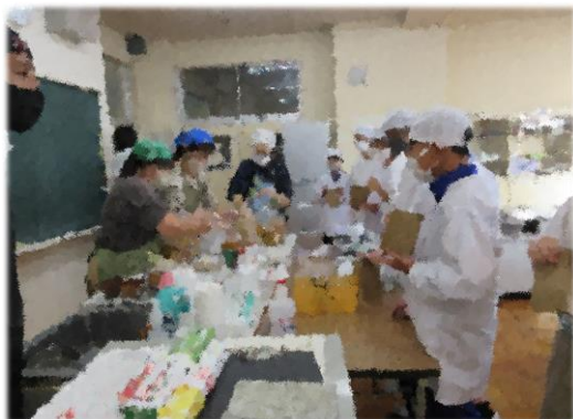
【↑ 1 学年 PTA キャリア教育への学習支援】