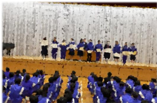
【↑ 冬休み前の集会「表彰」】