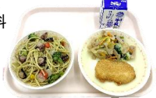
▲漬けたこと彩り野菜のジェノバ・バーゼスパゲッティ・牛乳・つくば鶏のチキンカツ・茨城れんこんのマスタードサラダ

バラエティ豊かな献立内容に地域でとれる旬の食材を取り入れ、郷土料理や行事食、世界の料理など多種多様な給食が登場。