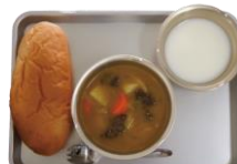
▲パン・ミルク・カレーシチュー

支援の小麦粉を使って作られたパンと、脱脂粉乳のミルク、おかずの給食が、都市部で始まる。