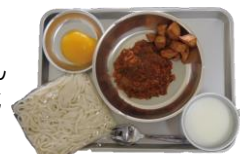
▲ソフトめん・ミートソース・ミルク・黄桃

時間がたっても伸びないめんとして、ソフトスパゲッティ式めん(ソフトめん)が開発される。