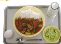
▲カレーライス・牛乳・塩もみキャベツ・ゆで卵