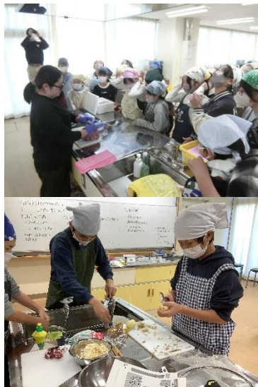
《あ印水産調理実習》