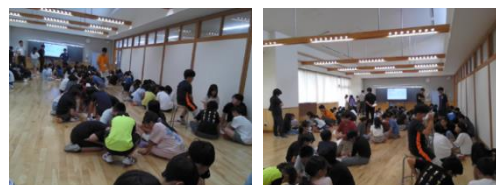
宝探しゲームの作戦会議の様子