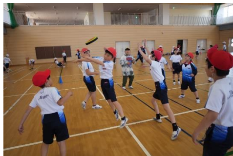
↑ みんなでフリスビーをつなぎます。