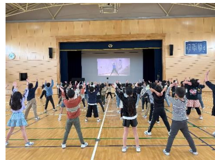
↑ スポーツ祭の練習も始まりました。