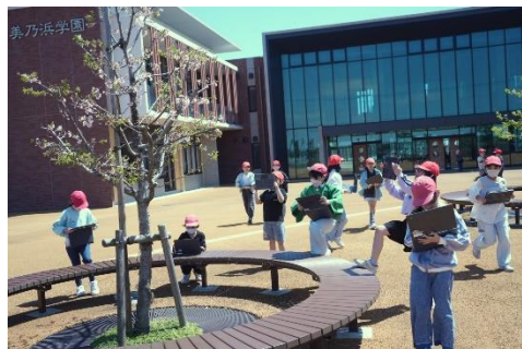
↑ 春の植物を観察しました。