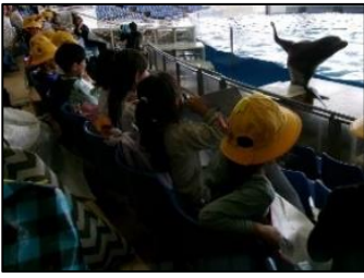
1年生 アクアワールド大洗