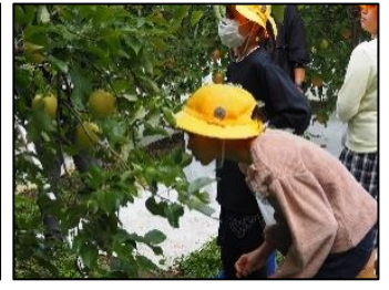
4年生 大子(りんご狩り・竹とんぼ)