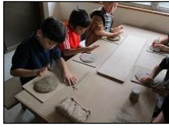
3年生 笠間焼き体験