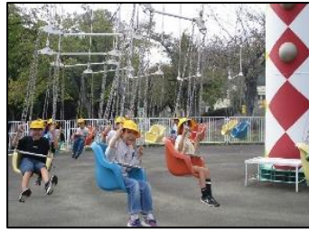
2年生 日立かみね動物公園