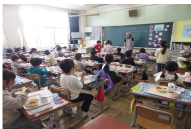
4/15 1年生初めての給食