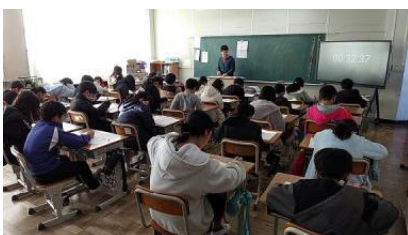
1/15、16学力診断のためのテスト