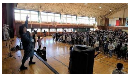
1/22 高野小「音楽の日」フェス