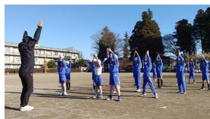
12/17 体育サポート授業