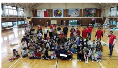
12/14 おやじの会イベント