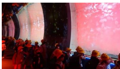
10/7 遠足 (1年生)