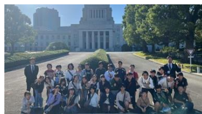
10/17 遠足 (6年生)