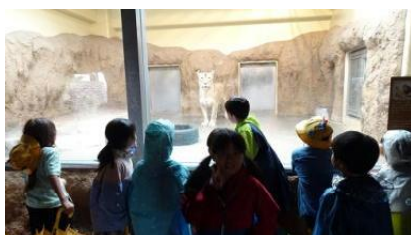
10/1 遠足 (2年生)