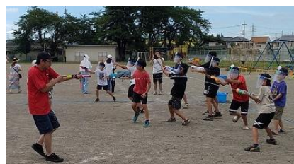
7/26・27 おやじの会キャンプ